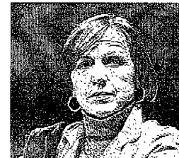
Banche Elsa Fornero , in lista per il consiglio di Sorveglianza di Intesa